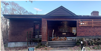
<ウトナイ湖ネイチャーセンター>